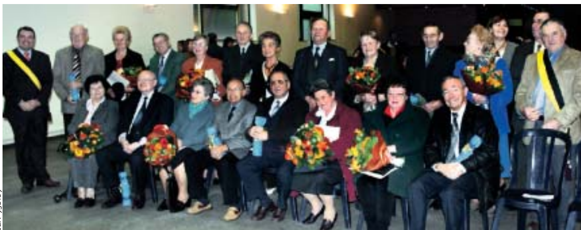
Les neuf couples jubilaires.